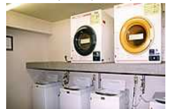
ห้องซักผ้า