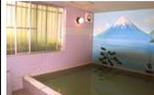
ห้องอาบน้ำ