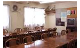
โรงอาหาร