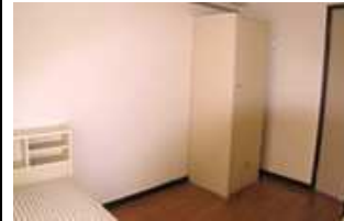
ภายในห้องพัก