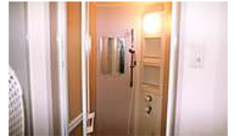
ห้องอาบน้ำฟักบัว