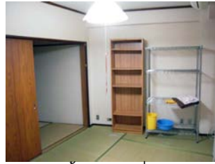
ห้องแบบที่ 2