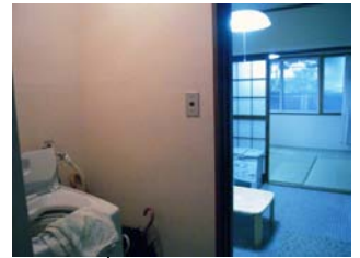
ที่สำหรับซักผ้า