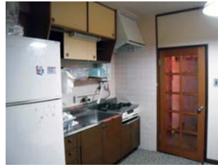
ห้องครัว