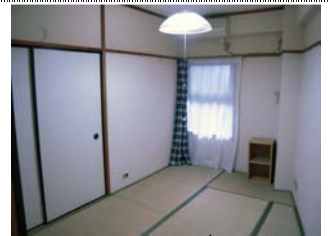
ห้องแบบที่ 1