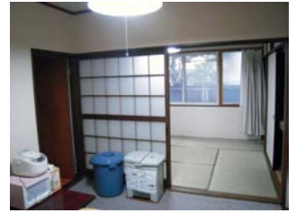
ห้องอาหารพร้อมห้องครัว