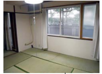
ห้องแบบที่ 3