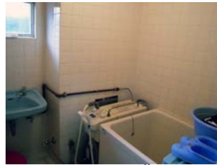
ห้องอาบน้ำ