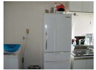
ห้องอาหาร พร้อมห้องครัวในตัว