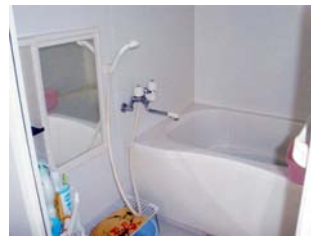
ห้องอาบน้ำ