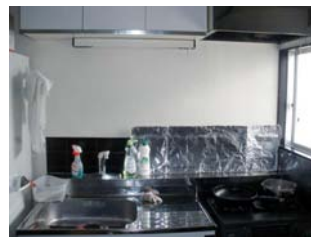
ห้องครัว