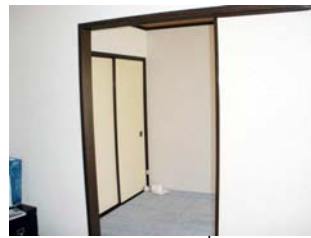
ห้องแบบที่ 1