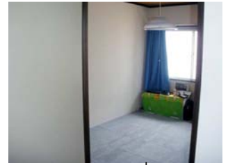
ห้องแบบที่ 2