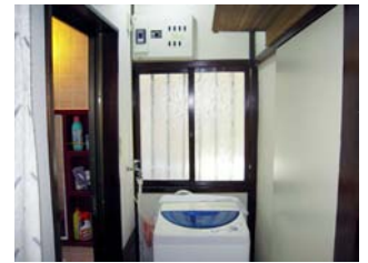
มุมสำหรับซักผ้า