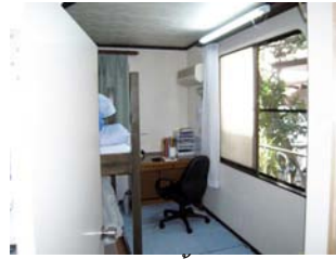
ห้องชั้น 1