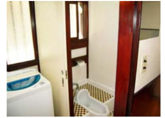
ห้องส้วม