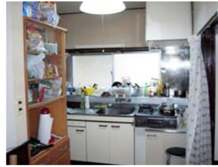
ห้องครัว