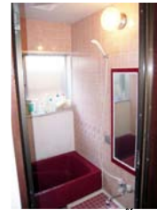
ห้องอาบน้ำ