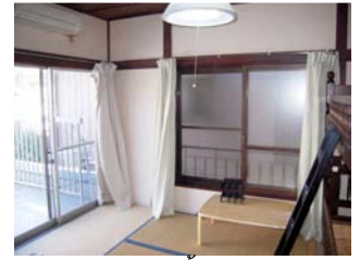
ห้องชั้น 2