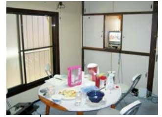
ห้องนั่งเล่นและห้องอาหาร