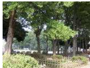
สวนสาธารณะ