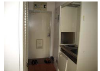
ห้องครัว