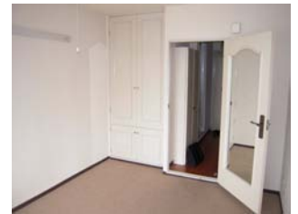
ภายในห้อง