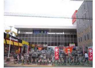
ซูเปอร์มาร์เก็ตใกล้ๆ

กรณีที่อยู่น้อยกว่า 6 เดือน ต้องจ่ายค่าเช่าเพิ่มอีก 3,000 เยน