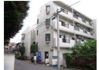
ตัวอาคาร