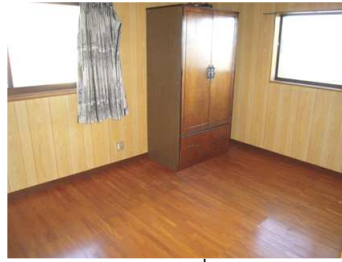
ห้องแบบที่ 3(2F)