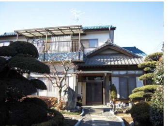
เรือนใหญ่ของเจ้าของบ้าน