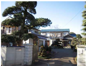
ทิวทัศน์โดยรอบ