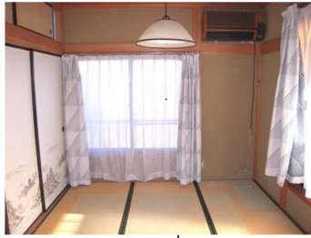
ห้องแบบที่ 2 (2F)