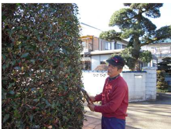
ภาพการทำงานของคณSuzuki