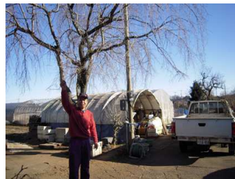
ลานกว้าง