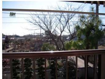
ต้นซากุระที่เห็นได้จากระเบียง