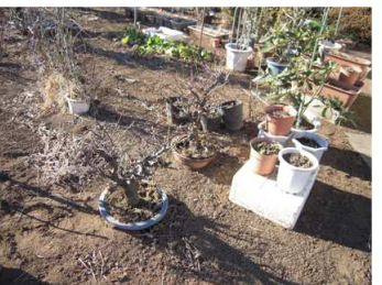
ต้นบอนไซ