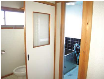
ห้องส้วมและห้องอาบน้ำ