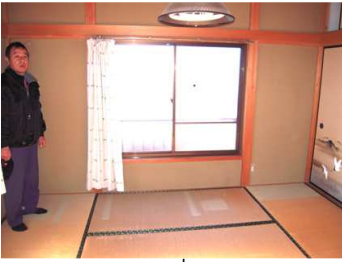
ห้องแบบที่ 1 (2F)

สำหรับผู้ที่ไม่เคยเห็นบ้านเช่ามาก่อนกรุณาดูรูปได้จากข้างล่างนี้ ถึงแม้ว่าจะเข้าไปหน่อยในสไตล์การตกแต่งญี่ปุ่นแต่สามารถที่จะเรียนรู้และแลกเปลี่ยนการสื่อสารกับผู้อาศัยคนอื่นหรือเจ้าของบ้านพักได้อย่างสนุกสนาน