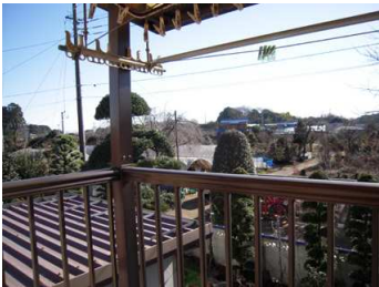
ทัศนียภาพสวยงาม