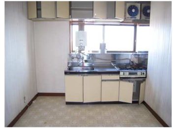
ห้องครัว