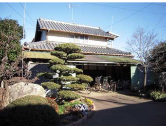
ที่เก็บของที่สร้างขึ้นสมัยเมจิ